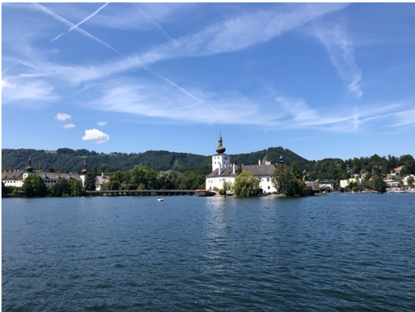
Seeschloss Ort in Gmunden