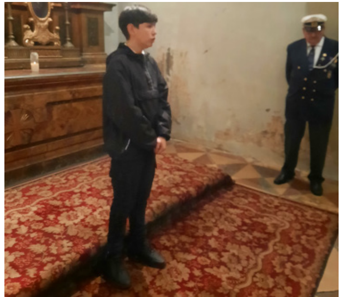
Wegeleister Junior beim Singen in der Michaela Kirche