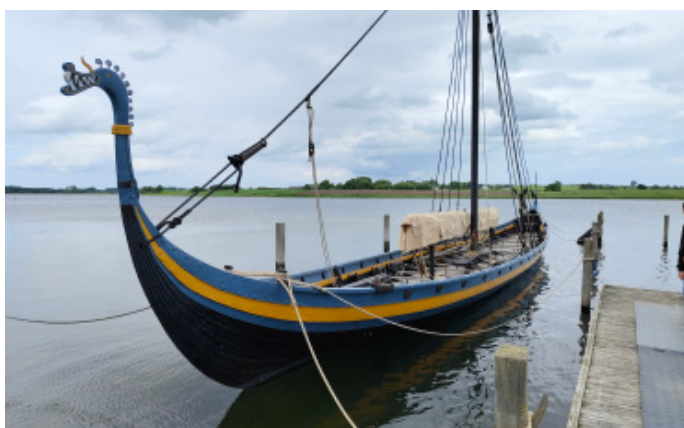
Wikingerschiff in Ladby