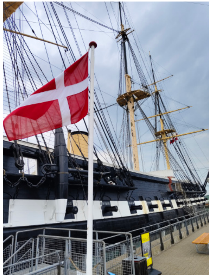
Fregatte Jylland, Ebeltoft