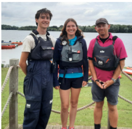
Links: Trainer für den Segelkurs