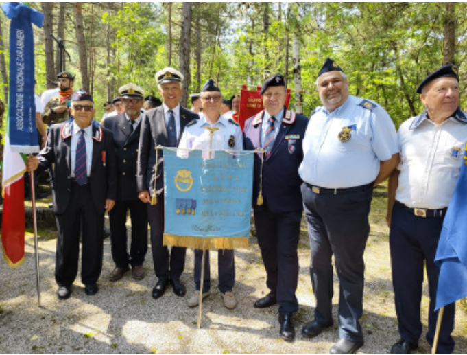
Kameraden der ANMI bei Gedenken

Auch heuer hat wiederum eine Fahrt eines Teiles des ÖMV-Präsidiiums zu einer Gedächtnisfeier des ANMI Trento nach Levico Terme stattgefunden. Dort ist es in einem Waldstück nahe der Stadt in den 50er-Jahren nach dem 2. Weltkrieg bei einer Übung zu einem folgeschweren Unfall gekommen, im Zuge dessen eine Mörsergranate im Rohr explodierte und einige italienische Soldaten des Battaglione San Marco ge-