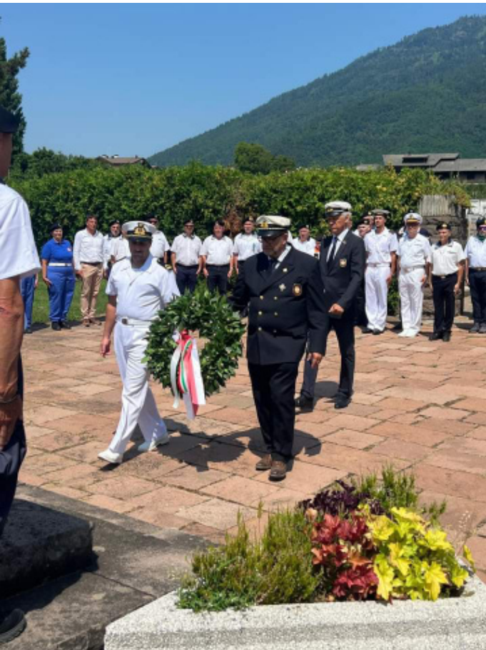
Kranz Beilegung am Denkmal für die Gefallenen der Weltkriege

Auch heuer hat wiederum eine Fahrt eines Teiles des ÖMV-Präsidiiums zu einer Gedächtnisfeier des ANMI Trento nach Levico Terme stattgefunden. Dort ist es in einem Waldstück nahe der Stadt in den 50er-Jahren nach dem 2. Weltkrieg bei einer Übung zu einem folgeschweren Unfall gekommen, im Zuge dessen eine Mörsergranate im Rohr explodierte und einige italienische Soldaten des Battaglione San Marco ge-