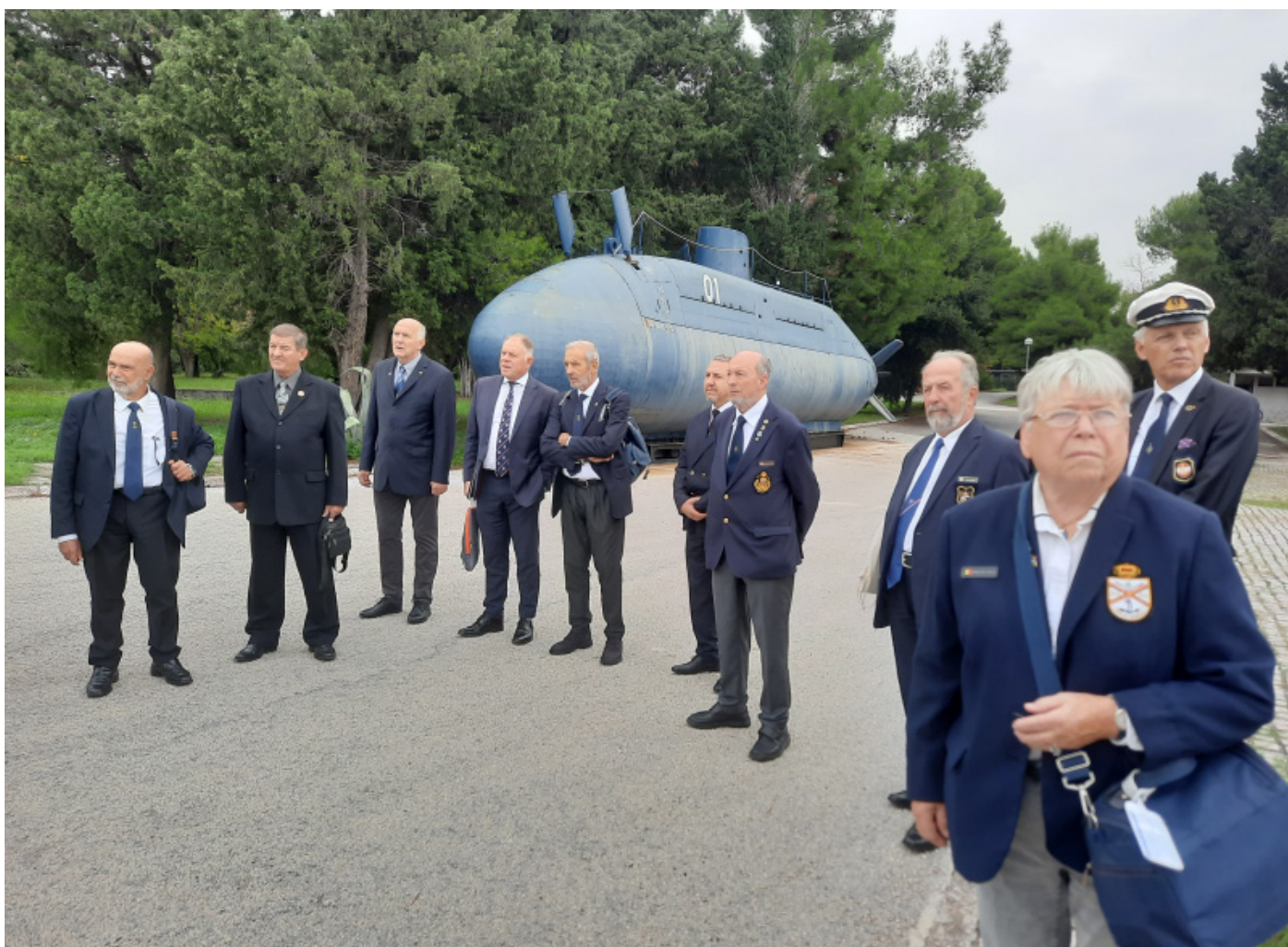
IMC Mitglieder vor historischem U-Boot im Marinehauptquartier Split

Die Tagung hat im Zeitraum vom 16.–18. Oktober 2024 stattgefunden. Am Donnerstag hat ein Treffen, die Lora Naval-Base, in Split stattgefunden, bei dem zunächst die Kroatische Marine in einem Vortrag präsentiert wurde und dann ein Raketenschnellboot vom Typ RTOP 11 besichtigt werden konnte. Am Abend fand dann ein Essen in einem kroatischen Spezialitätenlokal statt, bei dem Erfahrungen ausgetauscht sowie alte und neue Bekanntschaften gefunden werden konnten.