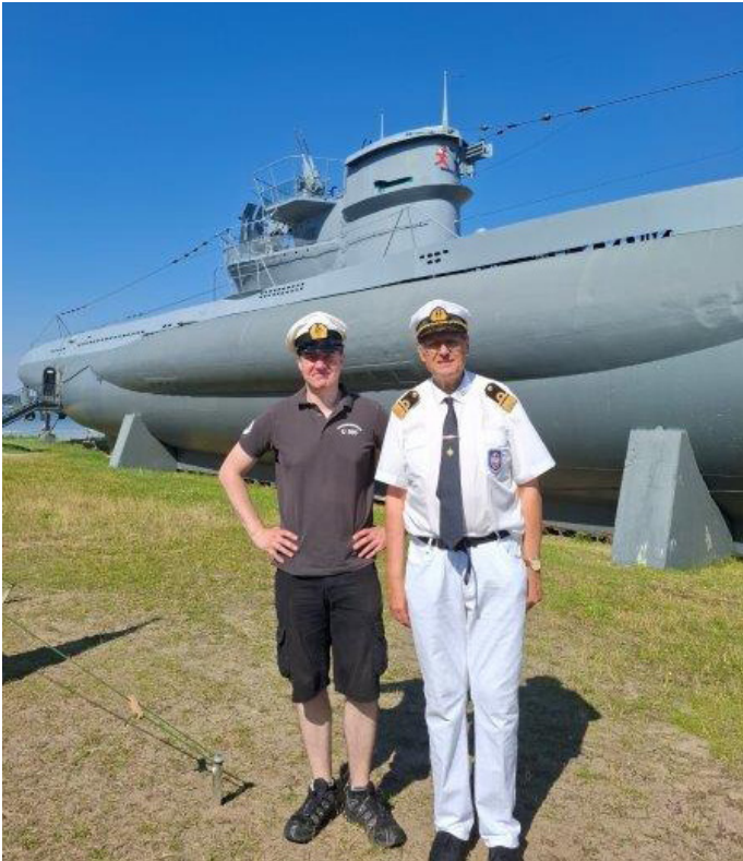
U 995 vor dem Ehrenmal

Am Donnerstag, den 18.7.2024 reiste ich nach LABÖ bei Kiel zu einem Besuch beim DEUTSCHEN MARINEBUND – DMB in dessen Hauptbüro im Gebäude des Hotel „ADMIRAL SCHEER“.